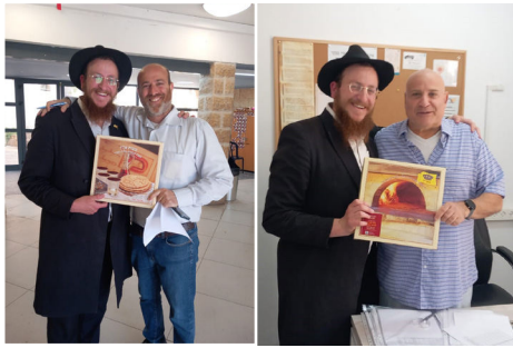
עם המנהלים בחלוקת המצות

הפעילות בשכונה הולכת וגדלה. בשנה האחרונה נפתח גן ילדים, והפעילות התרחבה גם מול התושבים, לדוגמה: ארגון שפרה ופועה לילודות. יצוין כי כמו עם בני הנוער, גם פה אנו רואים שכולם רוצים ושמוחים לשמוע על בשורת הגאולה, והתגלותו של הרבי שליט"א מלך המשיח, תיכף ומיד ממש". ■