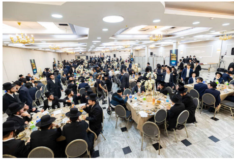
חלק ממשנתפי הוועידה השנתית

כמו כן, הארגון מפעיל תכניות חינוכיות לבני נוער, המשלבות לימודי חסידות, סדנאות יצירה וספורים במקומות קדושים. תכניות אלו זוכות לשבחים רבים מכל המשתתפים כשהם מושם דגש מיוחד על העמקת הזיקה לחיבור הנצחי בין האמונה בביאת המשיח שהיא מעיקרי היהדות לפעולות מעשיות לזירוז הגאולה האמיתית והשלימה. בנוסף, הארגון מפעיל פרויקט ייחודי להפצת ספרי חסידות לבתי כנסת ברחבי הארץ, מתוך מטרה להפוך את תורת החסידות לנגישה יותר לכלל הציבור.