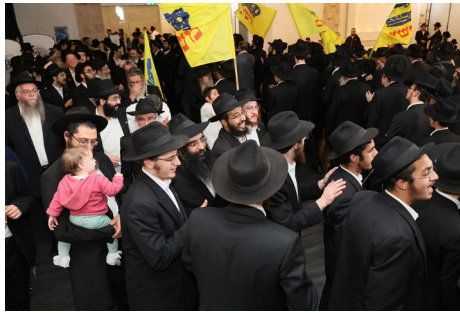
ברוב שירה וזמרה לקבלת פני משיח צדקנו

לסיום נערכת הגרלה מיוחדת בין המשתתפים באירוע, כשעל המסכים מוקרנים מראות תשרי ב-770.