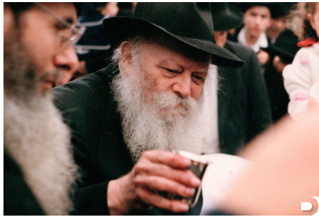
הרבי שליט"א מלך המשיח בחלוקת 'כוס של ברכה'

את ימי ראש השנה, ננצל כדי לגרום את הפעולה המכרעת, ובמיוחד על ידי הגברת 'מבצע שופר' - זיכוי הרבים בכל מקום בשמיעת תקיעות השופר, המזכירות את קול השופר עליו נאמר "תקע בשופר גדול לחירותינו" - הקול שאנו מצפים לשמוע אותו, נאוו עכשיו ממש! ■