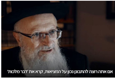
אם אתה רוצה להתבונן נכון על המציאות, קרא את 'דבר מלכות'

"אני חושב שכל אחד שלמד פעם דבר מלכות מבין שאי אפשר להבין מה קורה בדורנו בלי לקרוא את הספרים האלה. אם אתה רוצה להתבונן נכון על המציאות, קרא את 'דבר מלכות', זה פשוט זכות גדולה הספרים האלה, זכות לנו שאנחנו יכולים ללמוד ולקנות את המבט המיוחד הזה. איזה זכות זאת!"