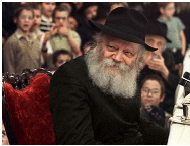
הרבי שליט"א מלך המשיח

הרבי – ראש בני ישראל – שבכל דור, תפקידו הוא להיות הממוצע המחבר' בין בורא עולם לעם ישראל, לחבר את העם אל ה', וגם להוריד את שפע הברכה מבורא עולם אלינו, לאנשים הגשמיים בעולם הזה. לכן הוא משמש כצינור השפע להורדת הברכות לעולם, בכל תחום אפשרי.