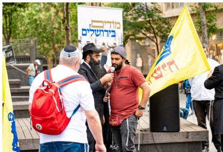
אחד התושבים באמירת פסוקים, באירוע

33 שנה חלפו, ושוב זכה עם ישראל, גם השנה לניסים גדולים באופן של "למכה מצרים בבכוריהם" כשאותם העולם מגינים על עם ישראל מפני איראן. הריקודים שהתקיימו בירושלים, (יצויין כי לצד הריקודים גם נפתחו דוכני כתיבה לרבי שליט"א מלך המשיח, באמצעות האגרות קודש, שגררו התעניינות מרובה) מתוך שבח והודיה על כל הניסים שהיו ושיהיו, בוודאי פעלו את פעולתם, כפי שאומרת הגמרא שנתינת ההודיה לה' היא המזרזת את הגאולה האמיתית והשלימה, תיכף ומיד ממש. ■