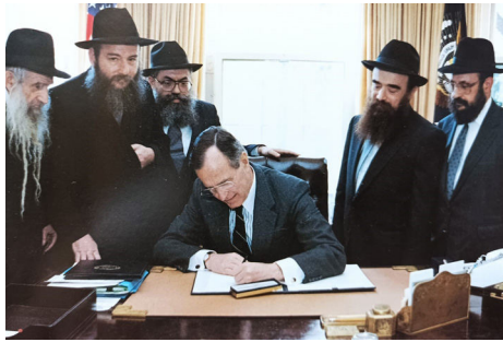
הנשיא בוש חותם על הצהרת יום החינוך

והשיתוף" של ארצות הברית מוכרז בכל שנה לפי התאריך העברי בו חל יום הולדתו של הרבי שליט"א מלך המשיח, ולקראת י"א ניסן, מוציאה נשיא המדינה מכתב בו הוא מציין את התאריך הלועזי המקביל באותה שנה, וקורא לציין כיום החינוך. נוסח ההצהרה קבוע בעיקרו, כשכל נשיא מוסיף נופך משלו להכרזה. כך למשל, הנשיא ג'ורג' וו. בוש הדגיש בהכרזתו את דברי הרבי שליט"א מלך המשיח על חשיבותו של מעשה טוב אחד, לגאולת העולם כולו, והנשיא ברק אובמה האריך אודות חלוציותו של הרבי שליט"א מלך המשיח בתחום החינוך.