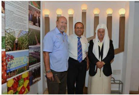
שייח' דרוזי מבקר במוזיאון

אני קורא לכל עם ישראל בואו לבקר אותנו עם כל המשפחה במוזיאון גוש קטיף בירושלים, ברחוב שערי צדק 5 ירושלים. דווקא היום יותר מתמיד צריך לזכור, לחזור ולהתיישב בכל חלקי ארץ ישראל".