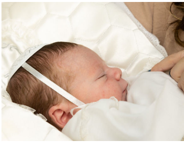
התינוק בבית המילה