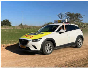
טנק המצבאים של התמימים, בפעולה

אחרי כזו תשובה, ארבעת הבחורים חזרו לרכב, כשהם מתמלאים מחדש במרץ וחיות, לרגל המשימה החדשה - להביא את שמחת החג לחיילים בבסיס הצמוד למעוז הרשע