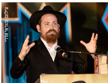
הרב יוסף יצחק לבקיבקר