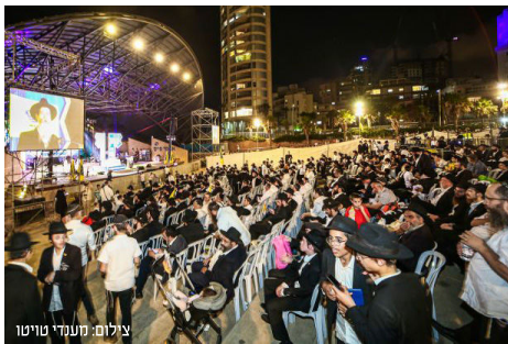
חלק מהקהל באירוע

לאחר קיום ההגדרה על מטבע מהרבי שליט"א מלך המשיח ובד מהרבנית, נחתם האירוע במחרוזת סיום של שירי משיח וגאולה. בלב כולם מתחזקת הציפייה להתגלותו המיידית של הרבי שליט"א מלך המשיח. ■