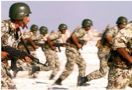
חיילים מצריים באימונים מלחמתיים

עוד לפני ביקורו הראשון של סאדאת, בישראל, התחיל הרבי שליט"א מלך המשיח להפציר בדחיפות ליישב את חלקי הארץ ולקבוע עובדות. לצד השיחות שנשא באותם ימים בנושא זה, הוא אף כתב על כך לאישים שונים. וכך נכתב למר אורי צבי גרינברג: "אולי ידוע כבר למר ממה שדברתי במוצאי שבת קודש פרשת לך אודות ההכרח הגמור ליישב בבת אחת כל השטחים, על כל פנים אותם שיש עליהם ערעור מאומות העולם. ולדעתי ברורה, רק זו היא הדרך שיתאשו שונאיהם של ישראל רחמנא לצלן ממזימתם הרעה".