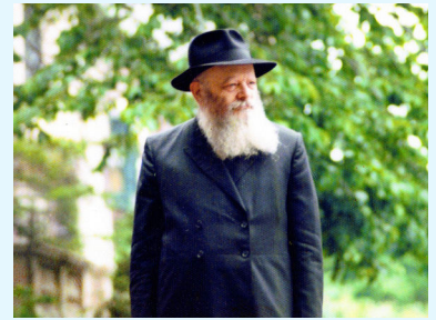
הרבי מלך המשיח שליט"א

כאשר נשאלת השאלה כיצד יתכן נביא בדורנו – השאלה היא אינה על חסידי חב"ד, אלא על הרמב"ם, שקבע שהנבואה תחזור לישראל לפני ביאת המשיח.