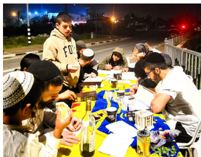
ברכות אצל יהושוע בן נון רבים מהעולים לשומרון עצרו בדוכן האגרות קודש לברכת הרבי שליט"א מלך המשיח

- בתורה שבכתב (ובפרט "בדברי הנביאים... שכל הספרים מלאים בדבר זה") ובתורה שבעל פה, בגמרא... ובמדרשים, וגם - ובמיוחד - בפנימיות התורה, החל מספר הזהר... ובפרט בתורת החסידות... בתורת רבותינו נשיאינו, ובפרט בתורתו (מאמרים ולקוטי שיחות) של נשיא דורנו - מעין ודוגמא והכנה ללימוד תורתו של משיח, "תורה חדשה מאתי תצא"... כפסק דין הרמב"ם ש"באותו הזמן... יהיו ישראל חכמים גדולים ויודעים דברים הסתומים וישיגו דעת בוראם כו" -