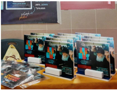
המוצר המיוחד...! הניסי

לפנות בוקר הוא קם והחל לקרוא פרקי תהילים כשפתח את אפליקציית המשלוחים, גילה הפתעה: החבילה בצרפת! העסק מתחיל להתקדם באופן שמיימי...!