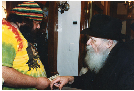
הרבי שליט"א מלך המשיח בחלוקת הדולרים

זאת ועוד: יהודי של עם ישראל ("עם זו יצרתי לי") מתבטא - לכל לראש - בקיומו הנצחי, שכן, למרות היותו עם קטן, כבשה אחת בין שבעים זאבים, נשאר קיים ונצחי (בה בשעה שעמים גדולים נכחדו מן העולם), בכחו של הקב"ה.