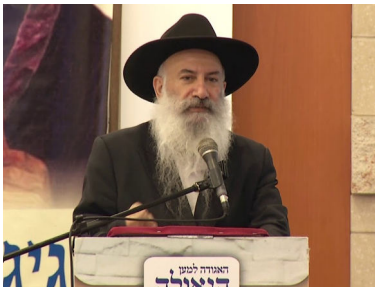
הרב הרצל בורוכוב