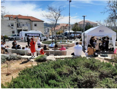
המונים עומדים במתחם לשמוע מנגילה

כ-1500 אנשים, נשים, נוער וילדים, זכו לקיים במתחם את מצוות הפורים. רבים אף ציינו שכבר מספר שנים שלא זכו לשמוע בחג הפורים את המגילה... ההצלחה היתה לשיחת היום