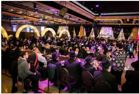
מתועדים יחד ביום הנשיאות