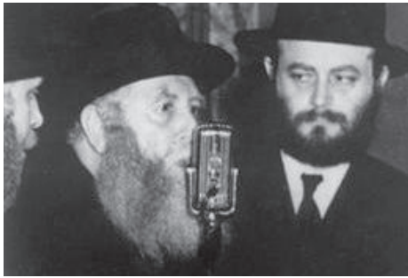
הרבי שליט"א מלך המשיח לצד הרבי הרי"צ

ומאז אכן שלח הרבי שליט"א מלך המשיח שלוחים לכל מקום בעולם - בכך הוא עורר את הניצוץ היהודי החבוי בתוך כל יהודי - מתאים לסימן אותו נותן הרמב"ם על מלך המשיח "ויכוף כל ישראל לילך בה (בדרך התורה) ולחזק בדקה". כעת עם ציון יום נשיאותו של הרבי שליט"א מלך המשיח - בטוחים אנו שנבואתו על דורנו תתקיים מיד ממש!