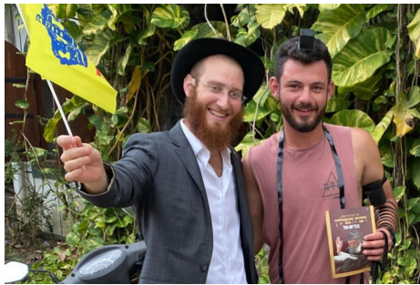
בהנחת תפילין ברחובות ווליגמה

"אנחנו מדברים על בשורת הגאולה, ורואים איך כולם מקבלים את זה מאוד יפה ובשמחה", אומר הרב גרומך. "פעמים רבות אנשים מתמודדים עם בעיות כלשהן בחיים, אך מבינים כי הפתרון היחיד הוא אכן משיח בן דוד. אנחנו צריכים לחזק ולהתחזק, ותמיד לחשוב ולהתבונן בזכות הנפלאה שנבחרנו להיות חלק מהכנת העולם לקבלת פני הרבי שליט"א משיח צדקנו, שיתגלה תיכף ומיד ממש".