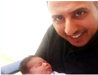
ישראל לצד בתו התינוקת