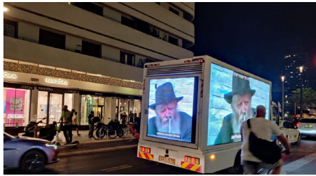
המשאית בחוצות תל אביב

"כמו משה רבינו שנתן את התורה לעם ישראל והשכינה דיברה מתוך גרונו, כך גם אצל הרבי שליט"א מלך המשיח שמעביר לנו דברי נבואה ומשמיע לנו את בשורת הגאולה. לכן שללתי את הצעת החברה ללוות את קטעי הוידאו במוזיקה כלשהי, כי חשוב שהציבור ישמע באוזניו את קולו הקדוש של מלך המשיח", הוא אומר.