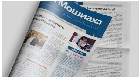
עלון 'ימות המשיח' ברוסית

לפני כשנה, בהמשך להתחדשות העלון השבועי של 'ימות המשיח' - 'שיחת הגאולה', עבר גם עלון 'ימות המשיח' ריענון ומתיחת פנים. הקוראים שמחו לגלות כי העלון קיבל עיצוב חדש ומודרני, והחל לצאת באיכות גבוהה ובצבע מלא מידי שבוע. השינוי המבורך הביא להתעוררות חדשה בקרב שלוחי הרבי שליט"א מלך המשיח ומפיצי בשורת הגאולה לקהל דוברי הרוסית, ורבים ביקשו לקבל את העלון המחודש מידי שבוע.