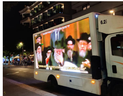
לראות את מלכנו - בחוצות תל אביב ביוזמת מספר פעילים, משאית ועליה מסכים, מפרסמת את דברי הרבי שליט"א מלך המשיח

מעמד מתן תורה, מתואר בתורה ובדברי חז"ל כאירוע משמעותי שהשפיע בעת ובעונה אחת בכל העולם. בשעה שנתן הקדוש ברוך הוא את התורה לעם ישראל, ציפור לא צייץ, עוף לא פרח, שור לא געה, הים לא נדעזע, אלא העולם שותק ומחריש. בני ישראל, שנעמדו למרגלות הר סיני, צפו בקולות וראו את הלפידים כשהם שומעים את השכינה הקדושה: "אנוכי ה' אלוקיך..." "לא יהיה לך אלוקים אחרים..."