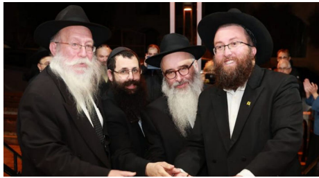
הרב גגולה (מימין) בפתיחת בית חב"ד בחיפה

הדברים אך רצו לשמוע גם את הסכמתו של רבם. אולם להפתעתם כאשר פנו אליו עם הידיעות ושלל המקורות הוא ביטל את הכל בכל מכל. שמעתי על המקרה והבנתי כי לא ייתכן שאדם תלמיד חכם יתייחס כך לנושא. אין זה אלא מפני דעות קדומות המפריעות לקבל החלטה אובייקטיבית, ולכן יש לעשות עבודת שטח, להפגיש את הרבנים עם המקורות והעובדות, ובכך לאפשר להם להכיר במציאות ההלכתית העומד מול עינינו, לפיה הרבי שליט"א הוא מלך המשיח".