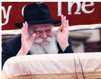
ל"ג שמח עם מלך המשיח הרבי שליט"א מלך המשיח מנופף לשלום לצועדים בתהלוכת ל"ג בעומר בחזית 770

הפרשה האחרונה בספר ויקרא, אותה קוראים השבת (בארץ ישראל), היא פרשת בחוקותי, הנפתחת בתיאור הבטחת הקדוש ברוך הוא, לטובה ושפע מיוחדים הניתנים לעם ישראל כאשר ילכו לפי חוקיו.