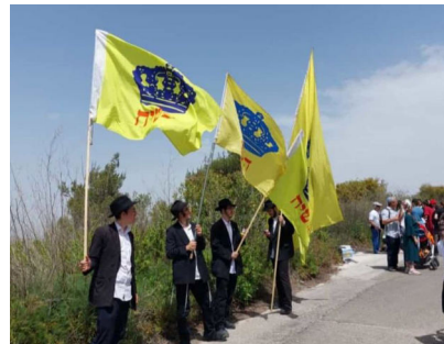
בשורת הגאולה בחומש גם האלפים הרבים שגדשו את הישוב חומש בצעדה הגדולה, נחשפו לבשורת הגאולה

הקדוש ברוך-הוא, כביכול, שיש לספק לו פרנסה, וכדומה. הבעל-שם-טוב, אשר ידע את מחשבותיו של הגאון, אמר לו: היהודים "יושבים" (ניזונים) מהפרנסה שמספק להם הקדוש ברוך-הוא, וממה "יושב" (מתפרנס) הוא, 'כביכול'? על כך אומר דוד המלך בתהלים "ואתה קדוש" - ומהי פרנסתך - "יושב תהלות ישראל": הקדוש ברוך הוא "יושב" על תהלות ושבחי ישראל, אשר מודים ומשבחים לה' יתברך על הבריאות ועל הפרנסה שהוא מעניק להם. ועבור מלות שבת אלו, שמשבחים ישראל לה', מברכס הקדוש ברוך-הוא בכל המצטרך.