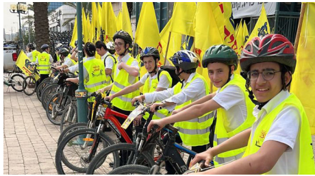
רגע לפני הזינוק

בראשון לציון, לעבר הטיילת ליד חוף הים בעיר. משם התקדמו הרוכבים אל בת ים, שם עצרו לאמירת 12 הפסוקים ו'יחי אדוננו'. לאחר מכן המשיכו אל יפו, גם שם נעצרו לאמירת 12 הפסוקים. בחלק האחרון הגיעו הרוכבים לתל אביב ועצרו במיקום מיוחד - ברחבה בטיילת, שם נשא הרבי הרי"צ מאמר חסידות בפני הקהל, בביקורו בארץ הקודש, לפני למעלה מתשעים שנה. כל עצירה שכזו כללה כמוכן חלוקת כרטיסי משיח ועלוני שיחת הגאולה והנחות תפילין לעוברים והשבים. משם המשיכה השיירה דרך הטיילת בתל אביב, לאיצטדיון בלומפילד.