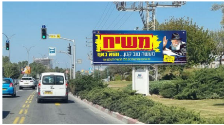
אחד מנמאות השלטים

למעוניינים לסייע: 054-2248770. או בעברת בנקאית לחשבון בנק מזרחי טפחות 20, סניף 468 חזון איש, מספר חשבון 37770, ע"ש מרכז ההפצה ממש. ■