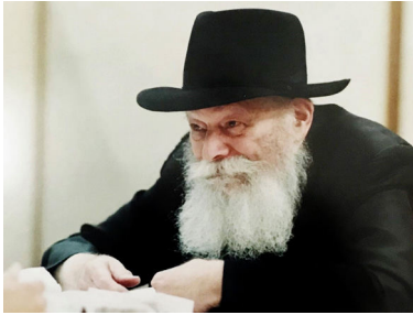
הרבי שליט"א מלך המשיח

חזרתי הביתה וסיפרתי לאישתי על הברכה הנפלאה שקיבלנו. החלטנו להגיש את הבקשה מחדש. אותה בקשה הבנק שמאי שיעריך את שווי הדירה