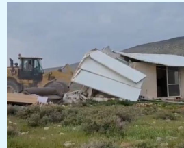
הרס הבתים