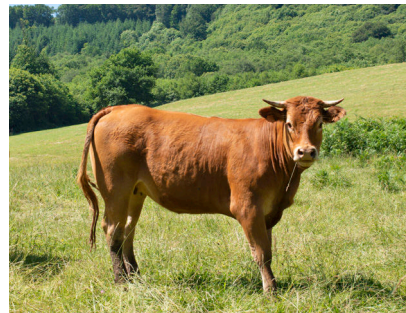
פרשת פרה - להיטהר לכניסה למקדש מצפים לעשיית הפרה האדומה העשירית, ותיכף ומיד ממש, על ידי משיח צדקנו

קריאת פרשת פרה בשבת זו, יש בה כדי לעוררנו לקראת התגלות הרבי שליט"א מלך המשיח, לעוררנו לקראת המצווה המיוחדת של הקרבת קרבן הפסח, שאנו מצפים לעשותו בשנה זו בבית המקדש השלישי. ואשר על כן, ראוי ונכון לנצל את ההתוועדויות הנערכות בבתי הכנסת, לאחר תפילת שחרית, לרגל השבת המיוחדת שהיא שבת מברכים, בה אנו נוהגים להתוועד, ולעורר את הקהל כולו, לבקשת הגאולה האמיתית והשלימה, ותיכף ומיד ממש, עוד בשבת המשרשת על בואו של חודש הגאולה, הבא עלינו לטובה.