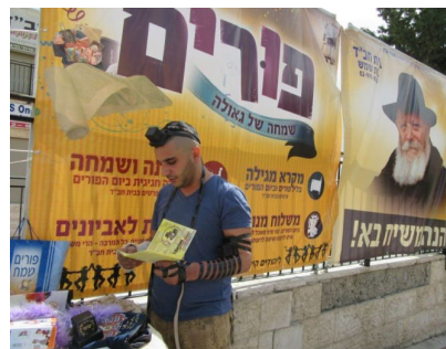
פורים, תפילין וגאולה תושב העיר בית שמש מניח תפילין בדוכן פורים. אמרו חז"ל: (וששון) ויקר - אלו תפילין

מבצעים אלו נבחרו בקפידה על ידי הרבי שליט"א מלך המשיח, בהיותם "מצוות כלליות" שאותם יש לקיים בהידור רב יותר ובזריזות גדולה יותר מאשר כל מצוה