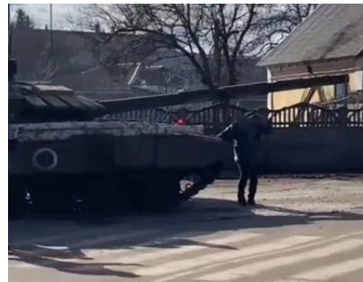
כוחו של אדם בודד תיעודים שמגייעים מאוקראינה, חושפים את עצירת כלי המלחמה, ללא אלימות

הרבי שליט"א מלך המשיח מעביר לנו את המסר של ההסתכלות הנכונה הנדרשת מול אירועים עוצמתיים המתרחשים בעולם. בדיוק כפי שהיה אז, בעת נס פורים, אותו אנו חוגגים החדש. נס המלובש בתוך הטבע. המגילה נפתחת בתיאור אירועי משתה אחשוורוש, "בשנת שלש למלכו", בהמשך עוברת לתאר את לקיחת אסתר לבית המלך "בשנת שבע למלכותו" ועד לסיפור הגזירה "בשנת שנים עשרה למלכותו", כאשר המן הפיל את הפור, וביטול הגזירה שנה לאחר מכן ביי"ג אדר. סיפור ארוך, המתפרש על פני עשור, שלא ניתן היה להבחין מלכתחילה בנס הגדול המתרחם והולך לאורך השנים, עד שהדברים כונסו במגילה לסיפור הנס המופלא.