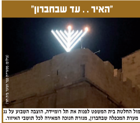
מול החלטת בית המשפט לפנות את תל רומיידה, הוצבה השבוע על גג מערת המכפלה שבחברון, מנורת חנוכה המאירה לכל תושבי האיזור.

אלא שהחשמונאים, בבית המקדש השני, לא הסכימו לחשוב על פחות מהמקסימום. הלא כל מלחמתם בכובש האימנתי לא היתה על זוטות, לא חיים חופשיים עמדו לנגד עיניהם ולא רווחה גשמית. מאבקים ההרואי היה על האמונה בה' וכנגד אלו אשר ביקשו