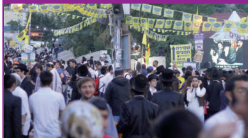
פעילות הפצת בשורת הגאולה של תלמידי ישיבת חסידי חב"ד ליובאוטש צפת ב"כיכר משיח" במרון ביום ל"ג בעומר.