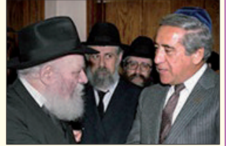
הרבי שליט"א מה"מ ובעל "היאכטה"

מעשה ביהודי עשיר שהיתה לו "יאכטה" שבה היה מפליג בים מפעם לפעם. יהודי זה התקרב ליהדות והתחיל לקיים תורה ומצוות, ובהפליגו ב"יאכטה" שלו, רצה להתפלל ולכוין פניו לצד מזרח, ולכן ביקש מ"ראש החובל" שיאמר לו היכן הוא צד מזרח. בפעם הראשונה לא גילה "ראש החובל" התעניינות מיוחדת בשאלה זו... בחשבו ש"מקרה נקרה" הוא. אבל בראותו ש"בעל הבית" שואל אותו מפעם לפעם היכן הוא צד מזרח - החליט