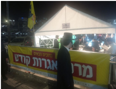
הדוכן בהילולת השל"ה

בשבוע שעבר, במהלך תוכנית "חידודון" בהגשת השדרן עמי מימון ברדיו "קול ברמה", נחשף סיפור מיוחד סביב מצבו הרפואי של המקובל הרב דב קוק מטבריה. הסיפור עוסק במענה שהתקבל באמצעות אגרות קודש אל הרבי שליט"א מלך המשיח ובהשתלשלות האירועים שבאה בעקבותיו.