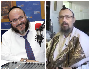
הרב קוק ר' עמי מימון