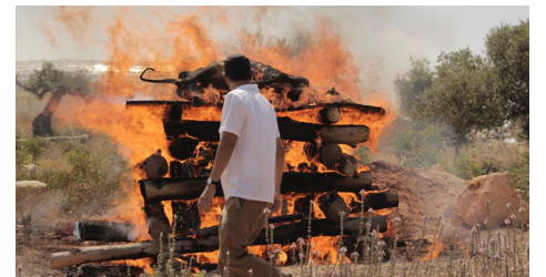
לימוד יצירתי. הדמיית מעמד שריפת הפרה

מטבע הדברים, מציאת העגלה המדוברת מעוררת ומחזקת אצל רבים בעם את רגש הציפיה לגאולה האמיתית והשלימה, בה נזכה כולנו תיכף ומיד להיטהר עם מי אפר הפרה ולעלות אל הר בית ה' בטרה. ואכן, זוהי אחת מפעולותיו של מלך המשיח מיד בבוא הגאולה האמיתית והשלימה – שריפת הפרה האדומה