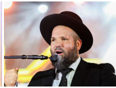
הרב משה פריס