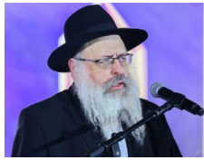
הרב זלמן לנדא