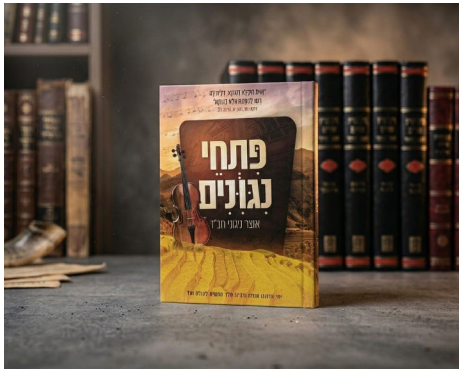
לעורר רגש לגאולה עם הניגון החסידי. חוברת "פתחי ניגונים"

"לניגוני חב"ד יש מעלה מיוחדת", חותם הרב לוזיה, "הם מרוממים את האדם מעל מגבלות העולם ומביאים אותו לידי שמחה אמיתית ופנימית. חז"ל אומרים שהגאולה מגיעה "בהיסח הדעת", והניגון החסידי הוא הכלי העוצמתי ביותר להסיח את הדעת מהגלות, ולחבר אותנו כבר עכשיו לתודעה של גאולה אמיתית ושלימה. נסו והווכחו".