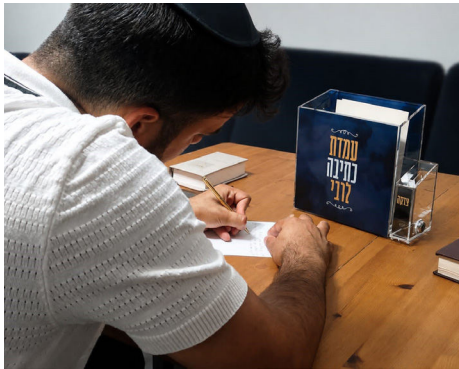
היום יותר מתמיד. עמדת הכתיבה בפעולה