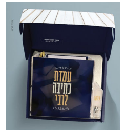
העמדה במארז קומפקטי

בדומה למדף הסיפורים המזמין את הנכנס לשלוף סידור ולהתחיל