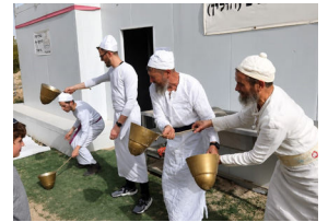
כהנים בתרגול עבודות המקדש

בדורות הקודמים, עוררו גדולי ישראל את כלל ישראל להתכונן לגאולה בלימוד חלקי התורה השייכים לעתיד לבוא - כמו מסכתות התלמוד בסדר קדשים. אך לאחר שבדורנו מודיע הרבי