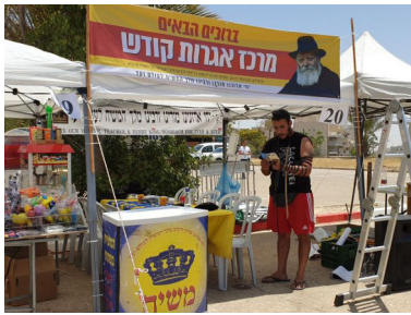
דוכן הפעילות בהילולא

לדבריו, הוא התחזק מאוד בשנים האחרונות ורוצה לבנות בית יהודי על יסודות של תורה ושמירת שבת, בעוד שבמשפחה עדיין יש יחס מקל יותר בעניינים אלו.