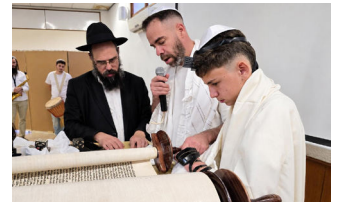
הרב תור בפעילות בר מצווה בקיבוץ

בהתאם לסביבה חסרת משמעות רוחנית הוא החל בגיל צעיר לחפש. במהלך שירותו הצבאי הוא חווה חוויה רוחנית עוצמתית שגרמה לו להבין שהתורה זה הדבר האמיתי. "אפשר לומר שמאז חזרתי בתשובה, אך עדיין לא נכנסתי למסגרת דתית. אחרי הצבא יצאתי לטיול בהודו, אך למרות ששם פגשתי לראשונה את חב"ד, אחרי שחזרתי לארץ נכנסתי דווקא לישיבה ליטאית".