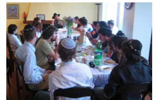
בשיעור בבית חב"ד

קהילת בני נח מוביל רותם פועלת כבר למעלה מ-20 שנה וממשיכה לגדול בהתמדה. "מדי יום ביומו"