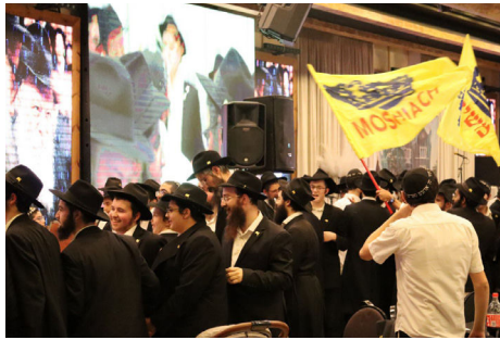
במהלך ריקודי השמחה

בסיום, לאחר ריקודים מלאי שמחה, התקיימה הגרלה על שטר של דולר שהתקבל מידו הקדושה של הרבי שליט"א מלך המשיח. הקהל יצא לביתו בתחושת התרוממות עזה, התקשרות מחודשת וחיות של 770 לכל השנה - עד להתגלות המלאה והשלימה תיכף ומיד ממש. ■