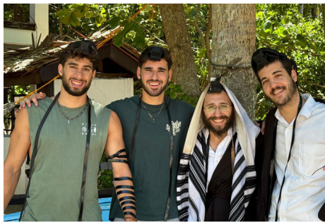
פעילות שהולכת וגדלה. הרב מענדל שפינדלר

כיום, בית-חב"ד מהווה יעד פופולארי מאוד בקרב קהל המטיילים באיזור. "בהשלמת הבנייה נוכל בעזרת ה' להעניק מענה מלא לכל המטיילים, כולל ובעיקר לקשר אותם למשלח - הרבי שליט"א מלך המשיח, ולפעול בשלימות את מטרת השליחות לקבלת פני משיח".