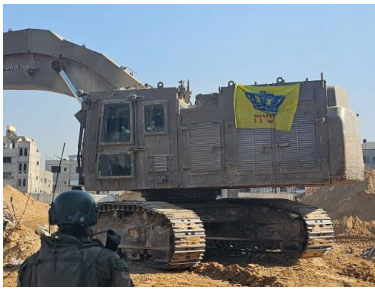
הדחפור עם הדגל עליו

"הרב מנחם, אני רוצה כעת להניח תפילין! לפי חוקי הפיזיקה, לא הייתי אמור להיות כאן עכשיו. וזה שאני חי - זה אך ורק בזכות בורא עולם ששמר עלי..."