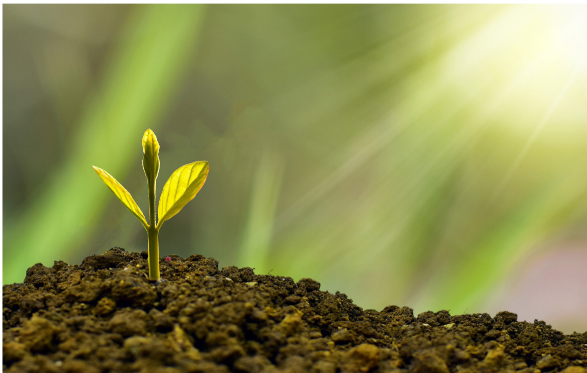
לצמוח מתוך הריקבון והירידה

אחרי שחווים דחיה וסירוב, הכי חשוב זה להפיק לקחים במהירות ולצאת לדרך חדשה, טובה יותר. כך עושים עם ישראל כל שנה, מיד אחרי תשעה באב