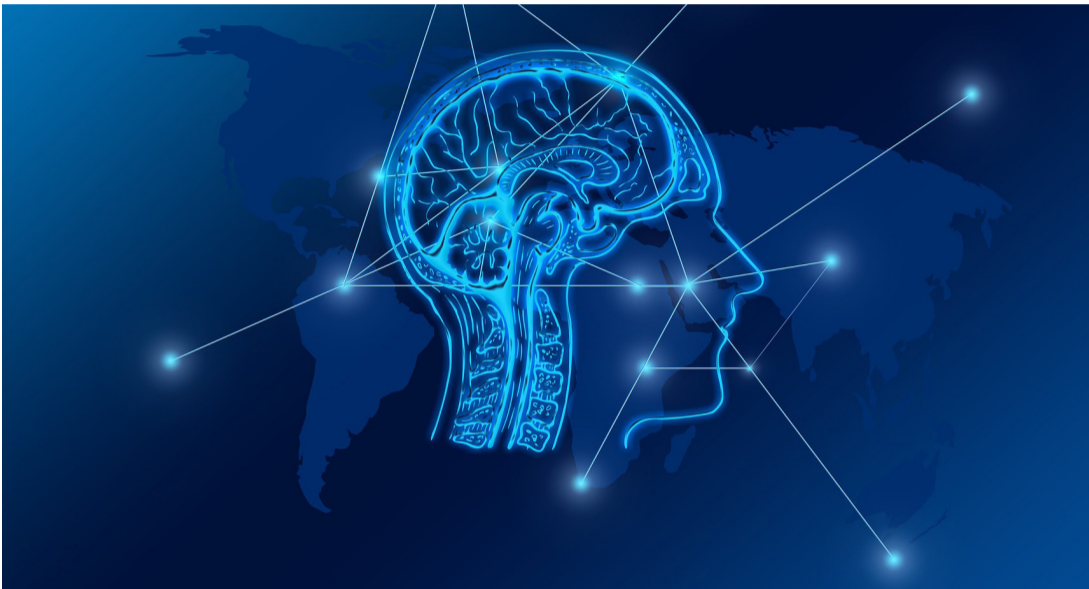
האם הכל תלוי במבנה המוח?

מחקר חדש גילה כי קיים קשר בין מבנה המוח ואופן פעילותו, להחלטות הפוליטיות של כל אחד. מתברר כי מעבר לחינוך וההשפעה המקיפה של הסביבה בה אנו חיים, מעניקים לנו ההורים גם את התכונות הפנימיות