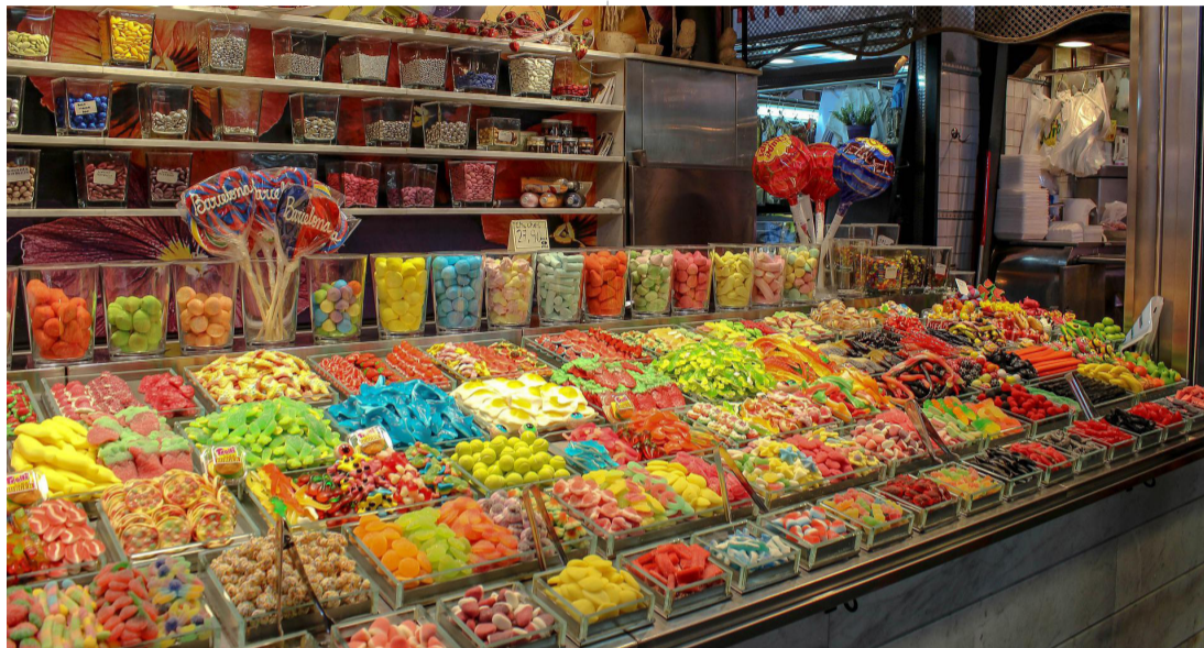
שפע של ממתקים יפתור את הבעיה?

האם יכול להיות שאנו מצפים למשיח רק בשביל שייפתרו כל הבעיות הכלכליות והבריאותיות שלנו? מה זה בעצם אומר משיח? מדוע מחכים לו בציפיה עצומה? ומה השינוי הגדול שהוא יביא כאשר הוא יגיע בקרוב ממש?