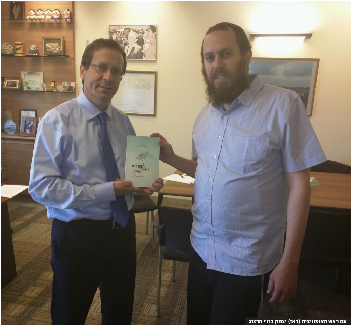
עם ראש האופוזיציה (דאז) יצחק בוז'י הרצוג

ואומרת לי שהיא קיבלה עכשיו טלפון של תוצאות הבדיקות שהיא עשתה ואמרו לה שכדאי לעשות ח"ו הפלה. כי יש סיכוי שהילדה תיוולד חולה, היא בכתה בטלפון ושאלה מה נעשה.