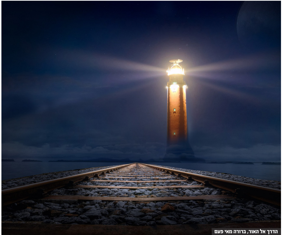
הדרך אל האור, ברורה מאי פעם

מבוסס על שיחות הרבי שליט"א מלך המשיח, שבתות פרשיות דברים, ואתחנן, עקב וראה ה'תשנ"א