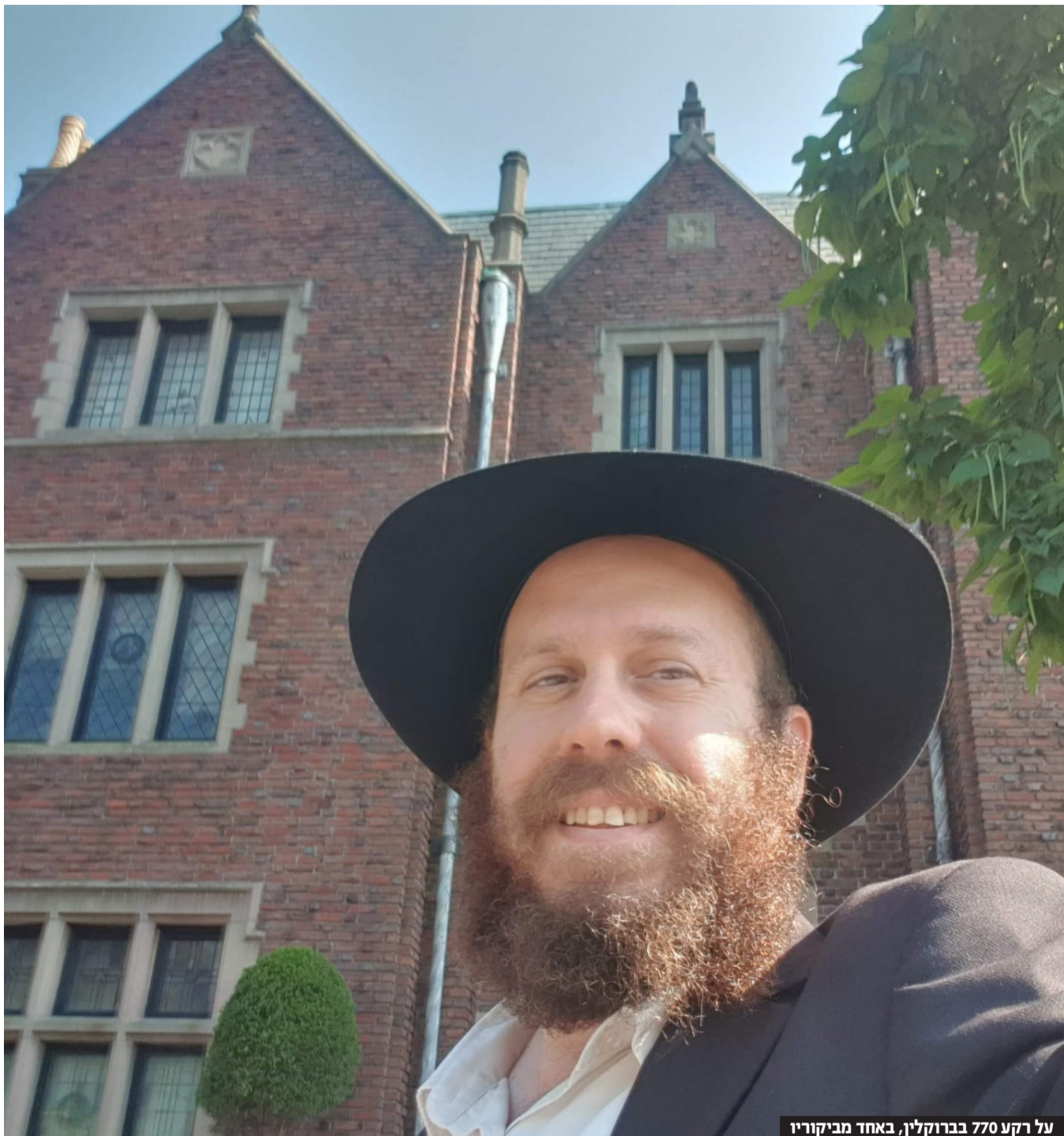
על רקע 770 בברוקלין, באחד מביקוריו

תוך שהוא מסייע לי בעצות וטיפים כיצד הכי טוב למלא את תוכן הכתבה. בסופו של דבר, הכתבה התפרסמה בעיתון ואני הייתי בעננים.