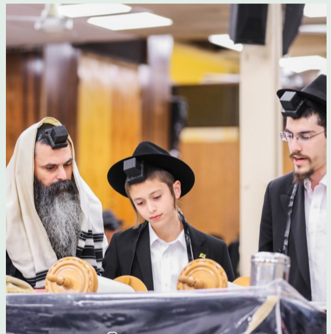
בר מצווה. גמר כניסת הנפש הקדושה לאדם

כולנו נחשפים ליום זה בדרך זו או אחרת, אך יום זה הוא בעל משמעות עמוקה גם ברובד החיצוני אך גם ואפילו יותר ברובד הפנימי שלו. הרבי שליט"א מלך המשיח מתייחס ליום זה בכובד ראש ולמהות העצומה שטמונה ביום מיוחד זה שמשול ליום החופה. גמר ועיקר כניסת הנפש הקדושה באדם היא כ"ב שנים אצל בנות, וי"ג שנים אצל בנים, שזה כבר מסביר את החשיבות של יום זה. הסיבה לכך שאצל הבנות אירוע זה נחגג שנה לפני הכניסה נובעת מכך שכינה יתרה ניתנה באישה, כלומר, הבנות מגיעות לשלימות ההבנה וההשגה ונעשות בנות-דעה לפני הכניסה.