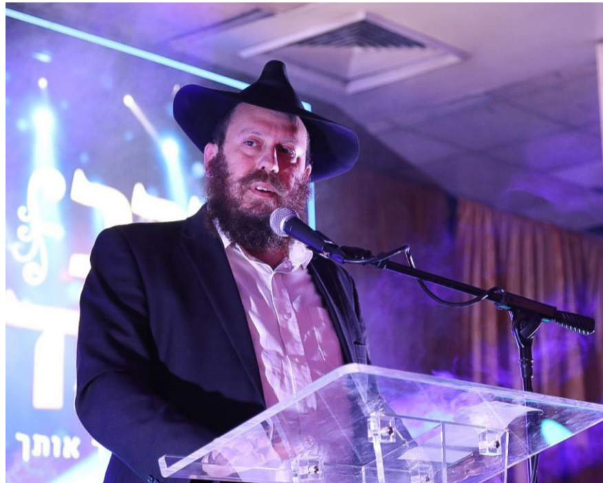
בכינוס לרגל יום ההולדת המאה ועשרים לרבי שליט"א מלך המשיח

שלי לגובה שלו, נתן לי נשיקה על הלחי, ואמר לי "וואו, תודה רבה לך, בזכותך אבנה השנה סוכה". הוא לקח את ארבעת המינים, שם בכלי עם מים, והתחלנו את הראיון. אחרי שנגמר הראיון, הוא מציע לי לפתע להגיד איתו "לחיים", שנינו אומרים לחיים, והאווירה מתחממת, ואנחנו מתוועדים ומדברים. ואז הוא פתאום אומר לי "תשמע, שלא תטעה, שלא תבין לא נכון - אני אתאיסט, אני לא מאמין בקדוש ברוך הוא". ואני חצי שיכור אומר לו: "תקשיב טוב אילן, האדמו"ר הזקן, מייסד תנועת חב"ד, גילה לנו שכל יהודי הוא חלק אלוהי ממעל ממש. ידעת שהרבי שליט"א מלך המשיח לא מסכים להשתמש במילה חילונית כלפי יהודי? אין דבר כזה יהודי חילוני, כי לכל יהודי יש לו חתיכה, חלק מהקדוש ברוך הוא שנמצא בתוכו, בין אם הוא רוצה ובין אם הוא לא רוצה, בין אם הוא יודע ובין אם הוא לא יודע. זה נמצא בתוכנו".